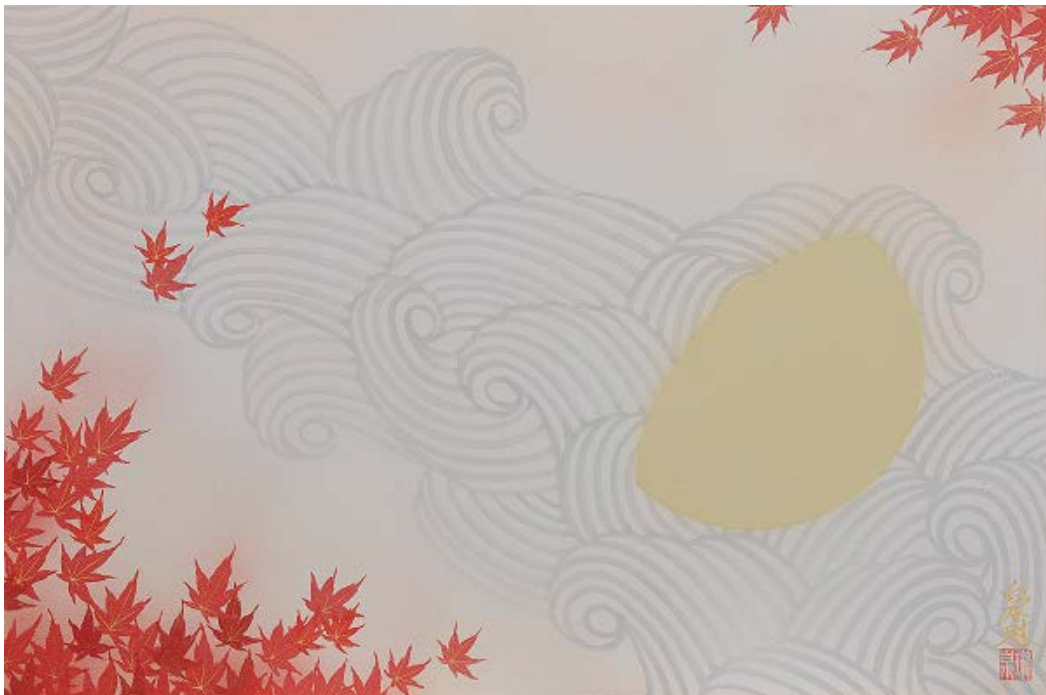
「秋の雅 - 月思ふ」 特製干菓子の掛紙原画