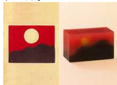
画像 左：『棹物御菓子見本帖』より『新更科』 右：季節の羊羹『新更科』

前半：皆川明(ファッションデザイナー) 中村至男(グラフィックデザイナー) 西淑(イラストレーター) 後半：皆川明 菊地敦己(アートディレクター) 塩川いづみ(イラストレーター)