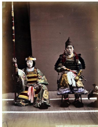
下関の兵士 / 本曾義仲と巴御前

KYOTOGRAPHIE 京都国際写真祭 2015にて、ヨーロッパにおける東洋美術の殿堂 フランス国立ギメ東洋美術館の写真コレクションが日本で初めて公開されます。